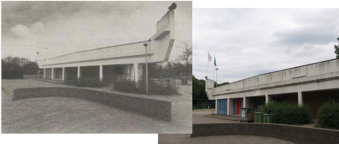
De buitenkant van het viaduct is in de loop der jaren nauwelijks gewijzigd

Sinds 1975 heeft Docos de beschikking over het sportcomplex de Mors 1 aan de Haagse Schouwweg in Leiden. Een sportcomplex zoals er velen in Nederland zijn: drie voetbalvelden, een trainingsveld, wat kleedkamers, een parkeerplaats(je) en een viaduct. Een viaduct???