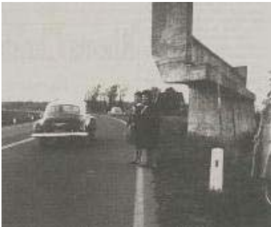
Een deel van het viaduct begin jaren '60 dat later wel werd opgeblazen

Om achter het hoe en waarom van het Docosviaduct te komen moeten we terug naar de jaren voor de tweede wereldoorlog. Anton Adriaan Mussert, sinds 1927 de hoofdingenieur van Rijkswaterstaat, bedenkt en ontwikkelt in de jaren '30 een aantal verkeersplannen waarin heel Nederland door autowegen moet worden verbonden. Een van zijn plannen omvat een rondweg rond Leiden. Een onderdeel daarvan is de verbinding tussen de toenmalige wegen 4A (Ypenburg-Amsterdam) en rijksweg 44 (Den Haag-Amsterdam). In die tijd loopt de verbinding nog door Leiden. Zowel in het huidige Zuid-West als in het Morskwartier worden al voor de oorlog