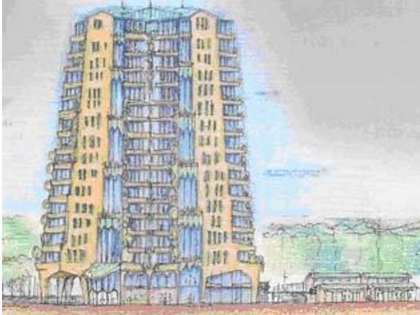
Het huis van de sport.....

Van de buitenkant van het clubgebouw van Docos kan veel worden gezegd, maar niet dat het een prachtig architectonisch hoogstandje is. Toch werd het gebouw in 1993 door het Algemeen Dagblad als een van de mooiste clubhuizen in Nederland verkozen naast de clubgebouwen van Avanti-wilskracht, JVV Rozenburg, PH, Bentelo, RKHV en LVV.